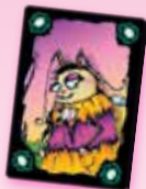
کارت زنبور متقلب