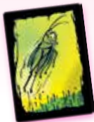
کارت ملخ پردرستر