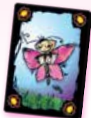
کارت پروانه زورگو