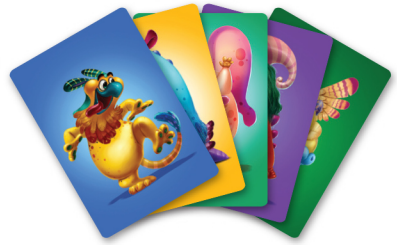
۵ کارت هیولا