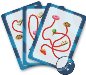
خطوط حاشیه سفید برای بازیکنان مبتدی

۳۱ کارت بازی: ۱۶ کارت آسان (خطوط حاشیه سفید برای مبتدی‌ها) و ۱۵ کارت دشوار (خطوط حاشیه قرمز برای بازیکنان پیشرفته؛ پشت این کارت‌ها یک ستاره قرمز چاپ شده است)