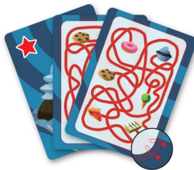
خطوط حاشیه قرمز برای بازیکنان پیشرفته